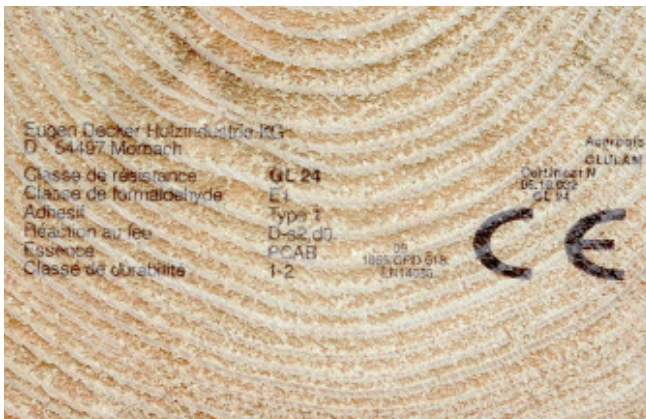
Marcado de madera

* La disponibilidad de las funciones individuales depende de la configuración del software del equipo