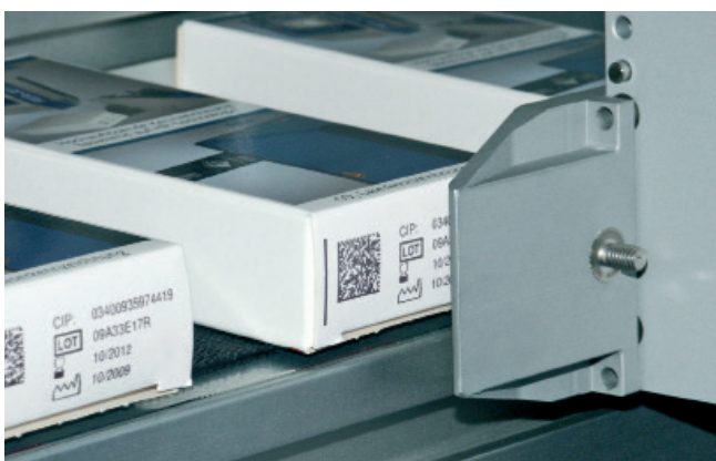
Codificación de cajas de cartón con código DataMatrix