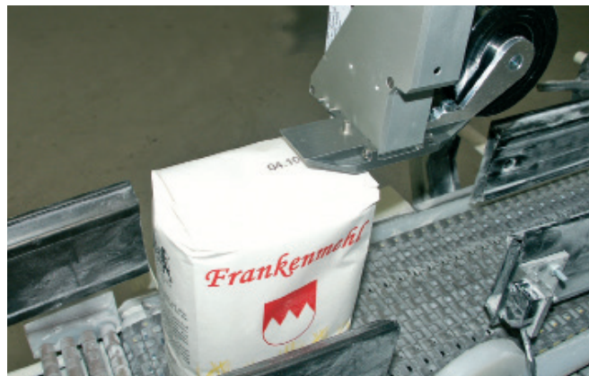
Marcado de paquetes de harina