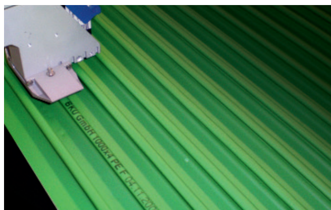
Codificación de chapas con perfiles plásticos